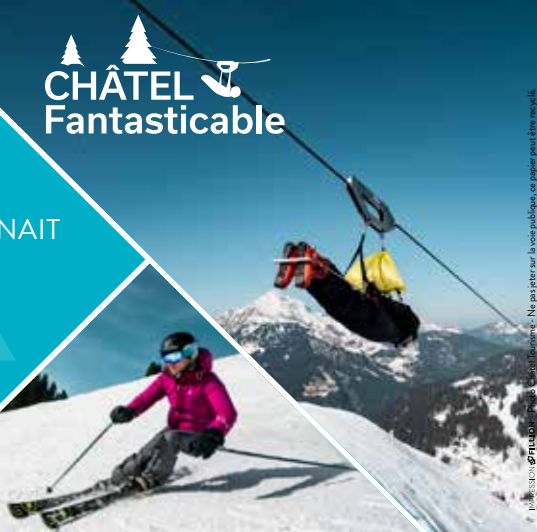
Ne pas jeter sur la voie publique, ce papier peut être recyclé.

Ça n'existe qu'à Châtel, entre deux descentes à ski, survolez les pistes à près de 100km/h !